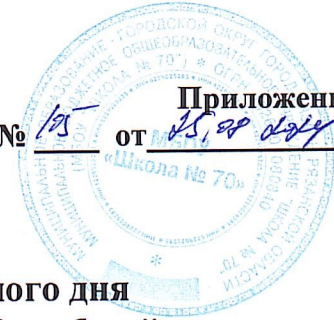
График работы групп продленного дня МБОУ «Школа № 70» на 2024-2025 учебный год