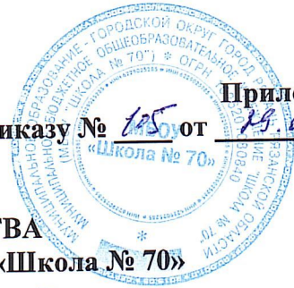
ГРАФИК ДЕЖУРСТВА членов администрации МБОУ «Школа № 70» на 2024-2025 учебный год

Приложение № 5 К приказу № 125 от 29.08.2024 г.