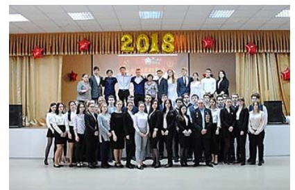
11 Б класс

Время безжалостно и беспощадно. Оно может стереть с лица земли все свидетельства битв и сражений, но не в силах уничтожить память матери-Родины о своих детях, отдавших жизни на полях брани.