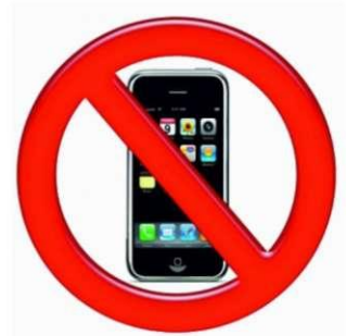
День отказа от мобильного телефона

Вспомните, как много значит тепло улыбки мамы, объятия ребенка и теплое рукопожатие друга. Без звонка, просто так, придите к ним, своим любимым и дорогим, и просто поболтайте за чашкой чая. Ничто не согреет лучше в морозный и ветреный февральский денек.