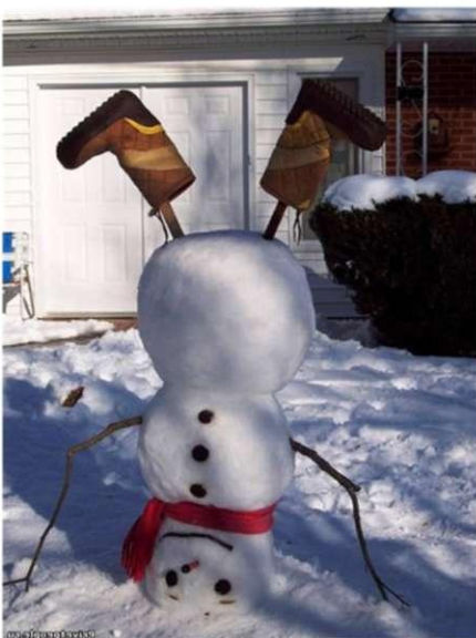
Так хочется зимы!!!!