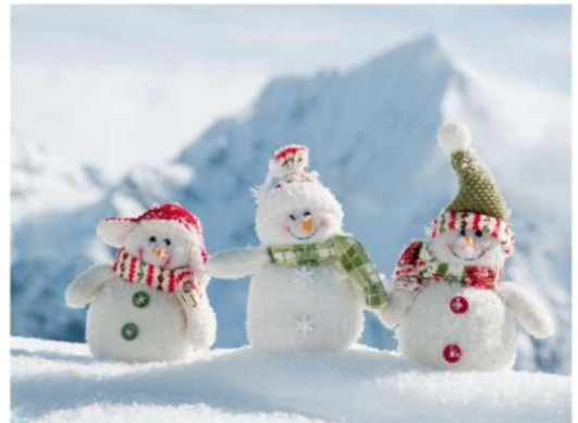
К Новому году готовы!

- Сынок, а вы в садике тоже дерётесь? - Да. - И кто побеждает? - Воспитательница.